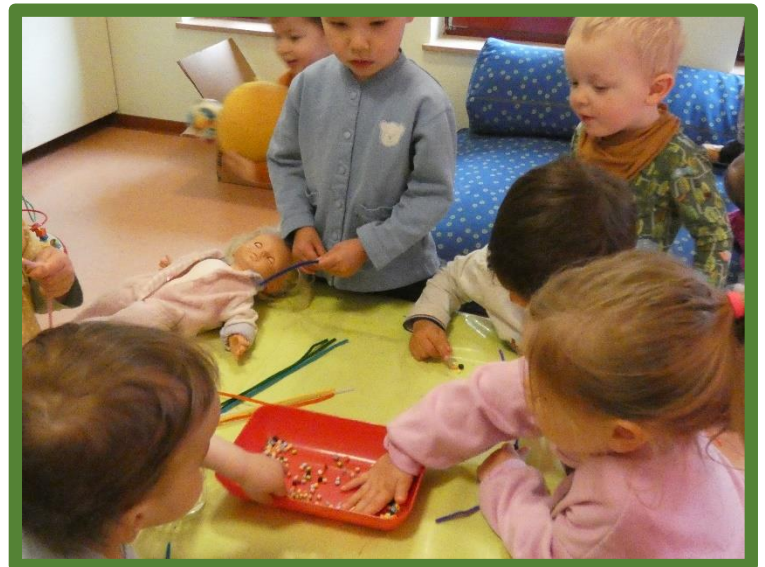
Das Auffädeln fordert volle Konzentration...