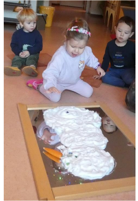
Riesenspaß mit Rasierschaum...