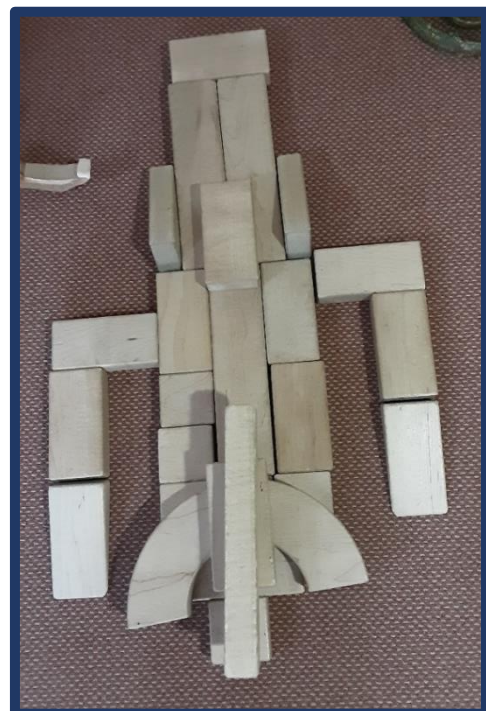
Die Fantasie ist grenzenlos – auch mit Holzbausteinen