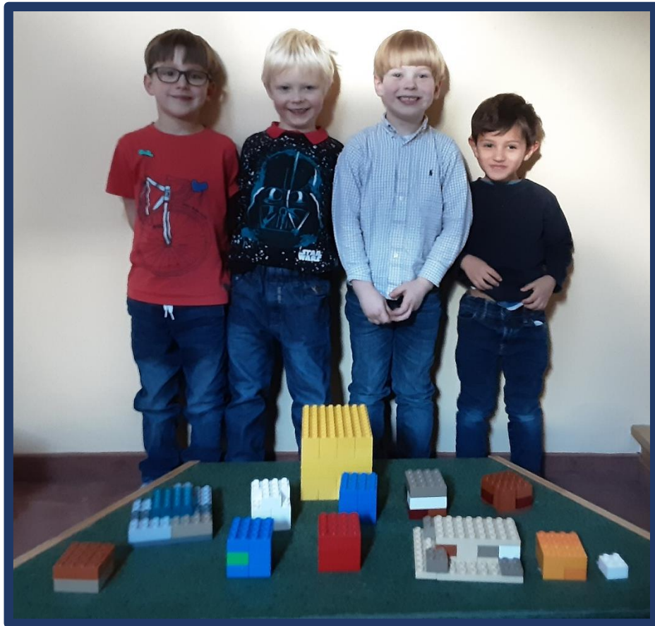
Unser Sonnensystem: Merkur, Uranus, Erde, Pluto, Sonne, Neptun, Eris, Saturn, Venus und der Mond. dargestellt mit Duplo-Steinen